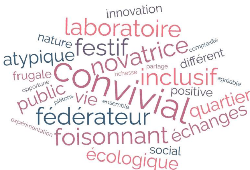
Figure 1 : Mots clés pour caractériser le Laboratoire Extérieur des Gratte-ciel (sondage diffusé aux participants en amont de l'événement du 23/11/23)