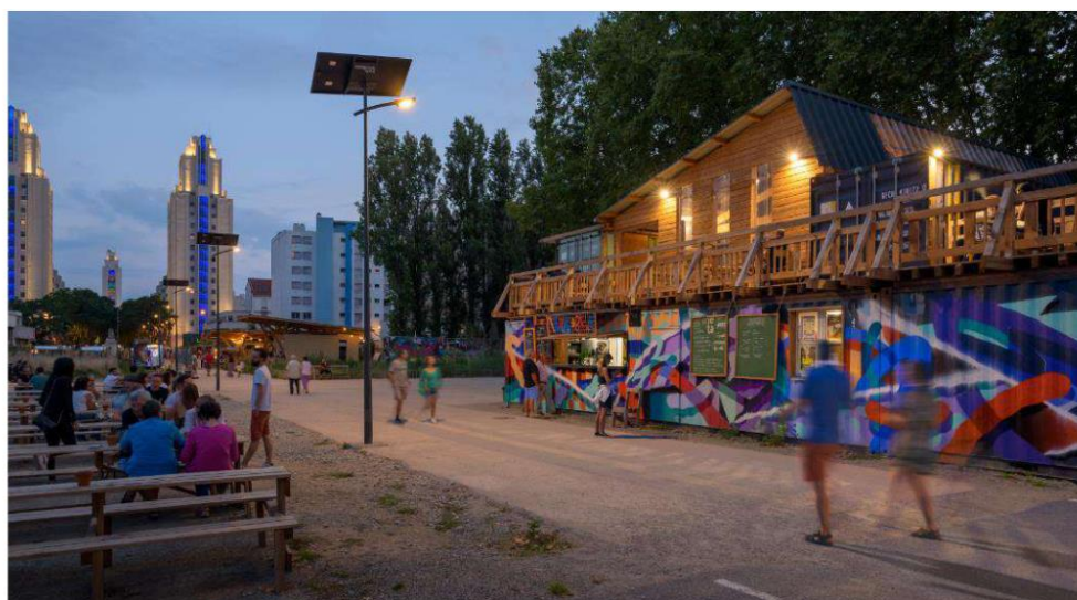
Figure 2 : Evolution du site du Laboratoire Extérieur des Gratte-Ciel