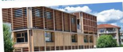
Pôle culturel le Briscope