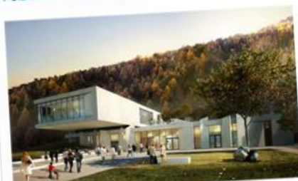
Espace culturel Avan.C