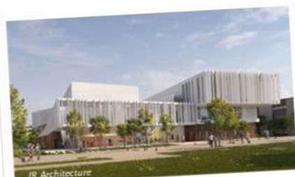
Conservatoire Hector Berlioz

d'échanges avec la salle, initiés par le comité technique