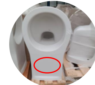
Sans trou d'abattant