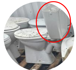
Réservoir en plastique