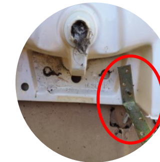
Lavabo sur équerre