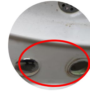
Lavabo avec 2 trous mitigeurs