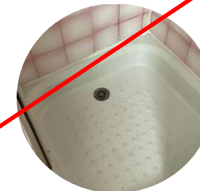
Receveur non plat