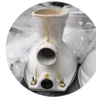
Cuvette pour réservoir haut